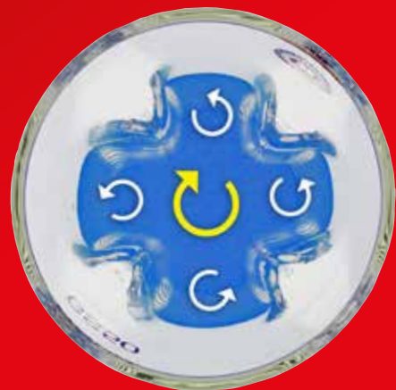
Principe du récipient GS (vue d'en haut)

Notre verres GS sont disponibles en verre borosilicate résistants aux produits chimiques et à la température ou en acier inoxydable. Ils sont disponibles dans des contenus de quelques millilitres jusqu'à plusieurs litres, avec ou sans couvercle et avec ou sans joints étanches pour la liaison.